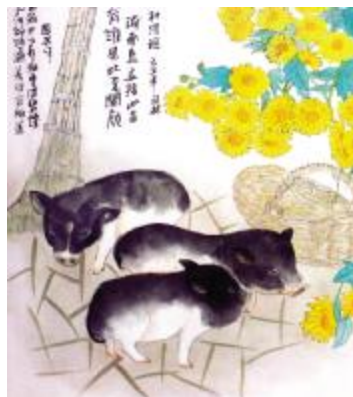
画 / 黄国林